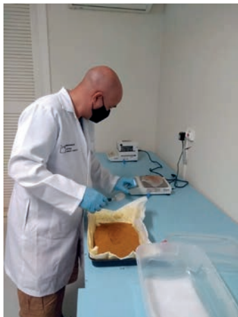
Figura 34. Pesagem