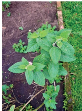
Figura 8. erva-cidreira 8