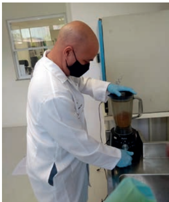
Figura 33. Moagem