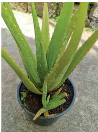
Figura 29. babosa 21