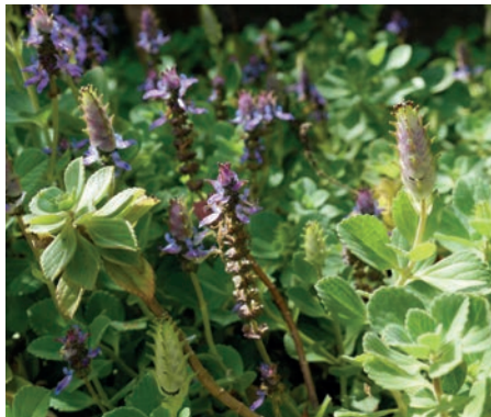
Figura 16. boldo-japonês 15