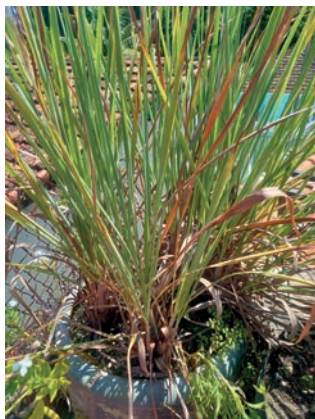
Figura 28. capim-limão 10