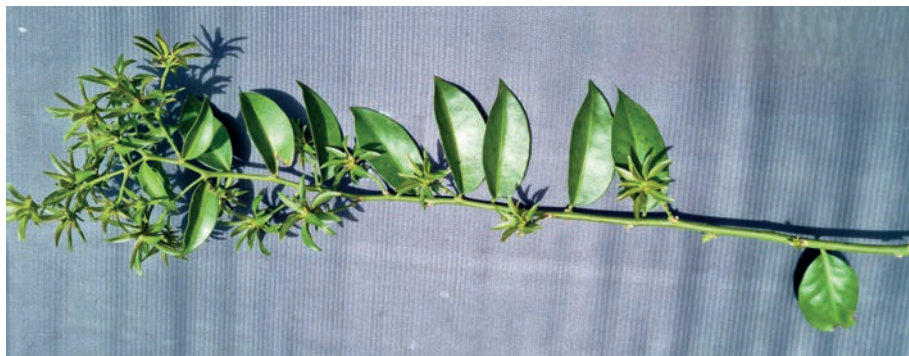
Figura 25. ora-pro-nobis 18