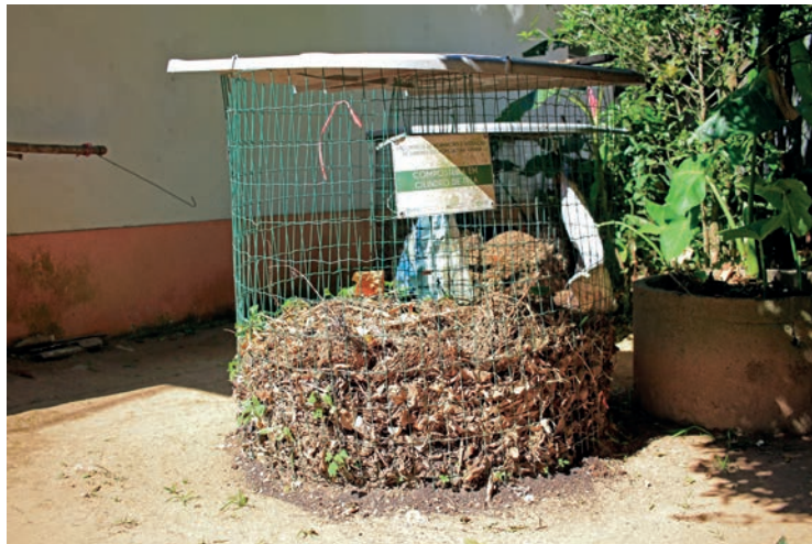
Figura 23. Compostagem em telas circulares