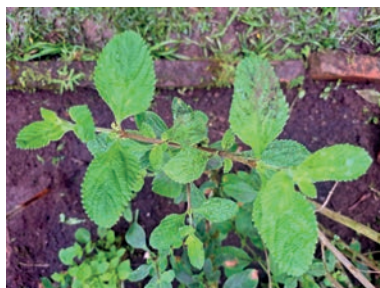
Figura 4. erva-cidreira 4