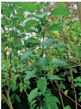
Figura 17. boldo-africano/alumã 16