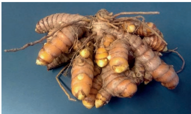
Figura 26. cúrcuma 19