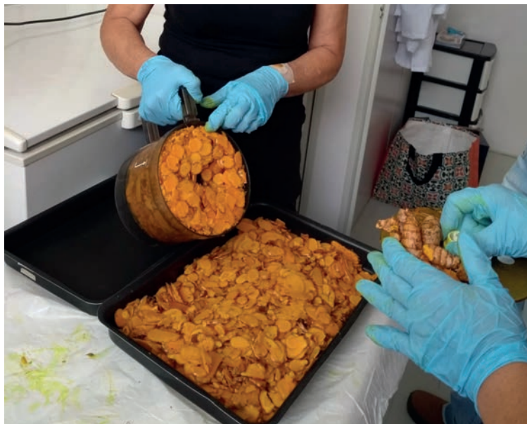
Figura 30. Fragmentação