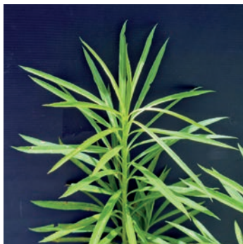
Figura 5. arnica 5