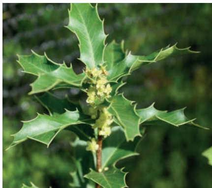
Figura 13. espinheira-santa 12