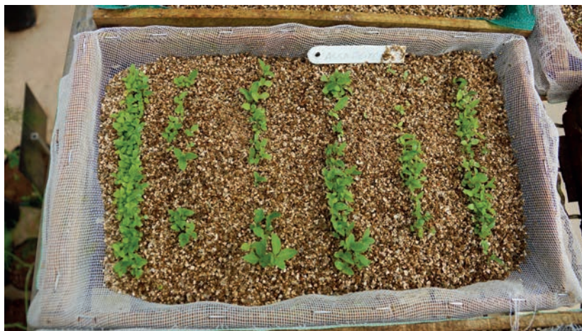
Figura 24. Plântulas de assa-peixe