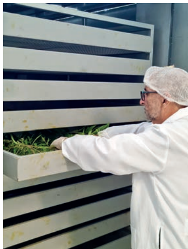
Figura 32. Estufa elétrica com circulação de ar