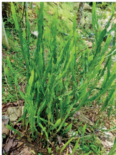
Figura 2. carqueja 2