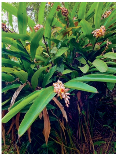
Figura 1. colônia 1