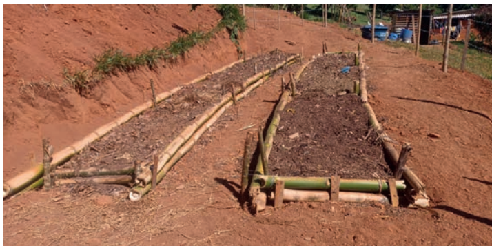
Figura 21. Compostagem em leiras