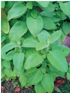
Figura 15. boldo 14