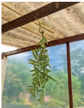
Figura 31. cidró 22