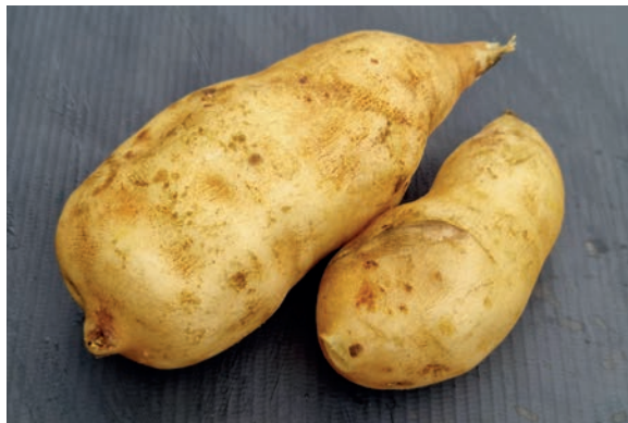
Figura 27. batata-yacon 20