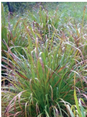
Figura 11. capim-limão 10