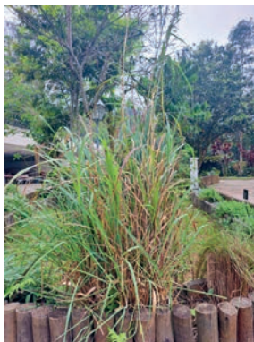
Figura 12. capim-limão 11