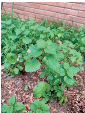
Figura 9. erva-cidreira 9