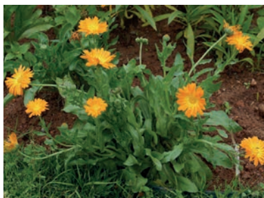
Figura 3. calêndula 3