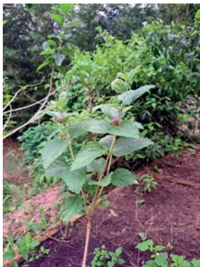
Figura 7. erva-cidreira 7