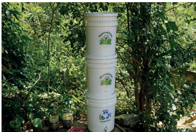
Figura 22. Compostagem em baldes